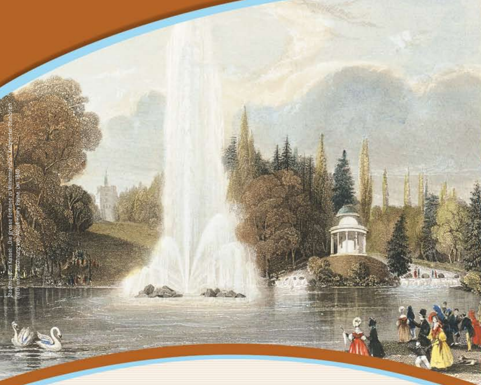
Stadtmuseum Kassel: „Die große Fontaine zu Wilhelmshöhe“, Kupferstich nach einer Zeichnung von Albert Henry Payne, um 1840.