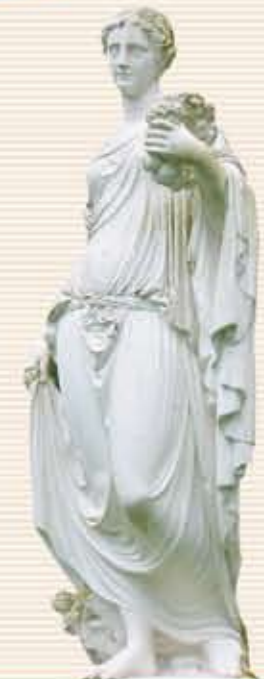
Flora im Bergpark Wilhelmshöhe