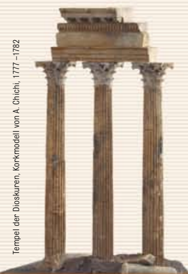
Tempel der Dioskuren, Korkmodell von A. Chiochi, 1777–1782

Die geschützte Höhenlage von 230-600 Metern und die Nähe zum Naturpark Habichtswald sorgen für das wohlthuende Mittelgebirgs-Reizklima.