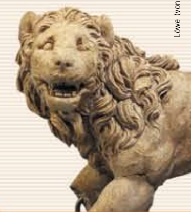
Löwe (von einem Grabmal), Kalkstein, um 300 v. Chr.