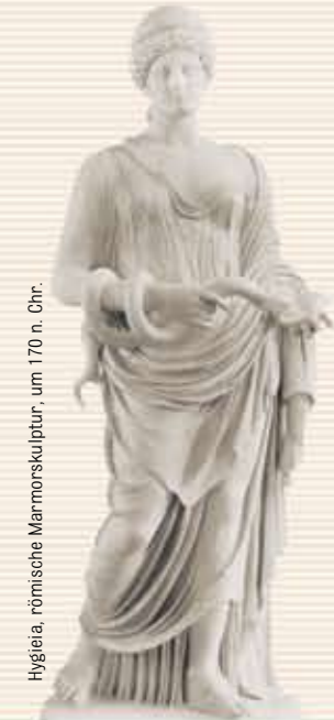
Hygieia, römische Marmorskulptur, um 170 n. Chr.

Allgemeine Gesundheitsvorsorge und Regeneration 🌿 Adipositas 🌿 ADS 🌿 Allergien 🌿 Atemwegserkrankungen 🌿 Burn-out 🌿 Diabetes mellitus 🌿 Erkrankungen des Haltungs- und Bewegungsapparates 🌿 Erkrankungen der Knochen und Gelenke 🌿 Erkrankungen der Nieren und Harnwege 🌿 Erkrankungen des Verdauungstraktes 🌿 Ernährungsbedingte Krankheiten 🌿 Ess-Störungen 🌿 Genesung nach schwerer Krankheit 🌿 Hauterkrankungen 🌿 Herz-Kreislauf-Erkrankungen 🌿 Hypertonie, Hypotonie 🌿 Infektanfälligkeit 🌿 Lebenskrisen 🌿 Lebererkrankungen 🌿 Migräne 🌿 Multiple Sklerose 🌿 Neurodermitis 🌿 Neurovegetative Funktionsstörungen 🌿 Onkologische Erkrankungen 🌿 Parkinson 🌿 Psychosomatische Erkrankungen 🌿 Skeletterkrankungen 🌿 Schlafstörungen 🌿 Schmerzsyndrom 🌿 Stoffwechselerkrankungen 🌿 Stresssyndrom 🌿 Rheumatische Erkrankungen 🌿 Tinnitus 🌿 Vegetative Dysregulation