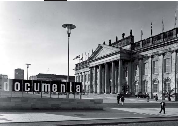
documenta 1, 1955, Museum Fridericianum

Die documenta ist die weltweit größte Ausstellung zeitgenössischer Kunst. Im Jahr 1955 wurde sie vom Kasseler Kunstprofessor, Künstler und Gestalter Arnold Bode ins Leben gerufen. Ziel der ersten documenta war es, jenen Künstlern ein Forum zu bieten, die von den Nationalsozialisten in Deutschland als >>entartet<< diffamiert worden waren. Die Ausstellung sollte die deutsche Öffentlichkeit nach dem 2. Weltkrieg mit der internationalen Moderne, aber auch mit der eigenen gescheiterten Aufklärung konfrontieren und versöhnen. Als Spiegel und Teil des kulturellen und politischen Klimas der Nachkriegszeit trug die erste documenta unter Arnold Bode, unterstützt von Werner Haftmann, wesentlich zur Rehabilitation und Durchsetzung der abstrakten Kunst in Deutschland bei. Dass sie zu einem solch beispiellosen Erfolg wurde, damit hatte niemand gerechnet. Seitdem findet „das Museum der 100 Tage“, wie die documenta auch genannt wird, alle fünf Jahre und seit 1968 unter wechselnder künstlerischer Leitung in Kassel statt. Die Ausstellung gilt als weltweiter Gradmesser der internationalen Gegenwartskunst mit mehr als 750.000 Besuchern. Die Geschichte der documenta ist aber auch eine Geschichte verschiedener künstlerischer und kuratorischer Positionen, in der sich unterschiedliche Philosophien und Theorien ebenso spiegeln, wie politische und gesellschaftliche Strömungen.