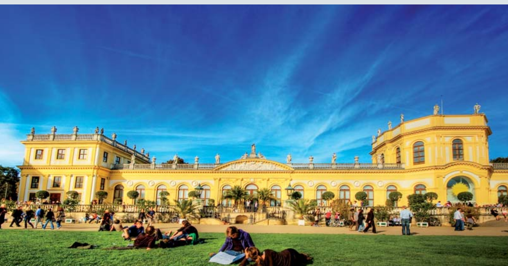
documenta Orangerie, Foto: Wolfgang Staudt