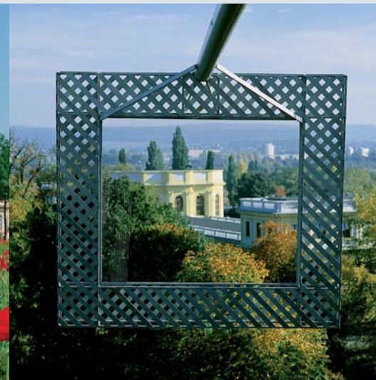
documenta 12, 2007, Sonja Ivekovic, Mohnfeld, 2007 Foto: Julia Zimmermann, © documenta GmbH